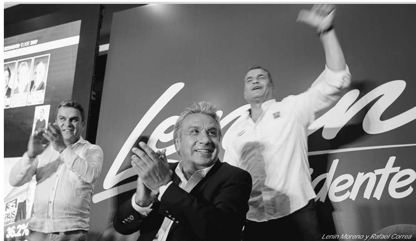
Lenín Moreno y Rafael Correa

Hay una figura ya mítica en la política ecuatoriana, que es la de "El Gran Ausente". La acuñó el pueblo para calificar al ex-presidente José María Velasco Ibarra, un líder populista que fue elegido cinco veces en las urnas y derrocado en cuatro ocasiones por sus enemigos políticos o por los militares. Después de cada derrocamiento, en el país se hablaba de "El Gran Ausente" y el pueblo se quedaba a la espera del regreso de su líder, para volver a en-