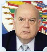
JOSÉ MIGUEL INSULSA, EXSECRETARIO GENERAL DE LA OEA Y EXAGENTE CHILENO ANTE LA HAYA

“Estoy pensando acá en el mar..., el diálogo es indispensable”, afirmó el Sumo Pontífice en la Catedral Metropolitana de La Paz, en su visita a Bolivia.