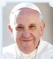
PAPA FRANCISCO (2015)

“Estoy pensando acá en el mar..., el diálogo es indispensable”, afirmó el Sumo Pontífice en la Catedral Metropolitana de La Paz, en su visita a Bolivia.