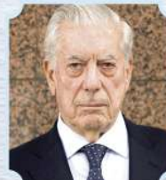
MARIO VARGAS LLOSA, ESCRITOR PERUANO (2004)

“Bolivia tiene todo, pero le falta esa salida al mar. El compromiso de toda nuestra América a luchar porque se haga justicia con nuestra querida Bolivia”.