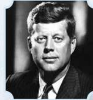
JOHN KENNEDY, EX PRESIDENTE DE ESTADOS UNIDOS (1963)

“El Libro del Mar debería llamarse el Libro del Mar Robado...”