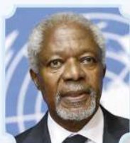
KOFI ANNAN, EX SECRETARIO GENERAL DE LA ONU (2003)

“Ya es hora de que Chile ofrezca propuestas concretas a Bolivia para solucionar su demanda de salida al mar”.