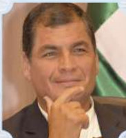
RAFAEL CORREA, PRESIDENTE DEL ECUADOR (2014)

“Hemos deseado siempre de que esta diferencia se pueda zanjar y que Bolivia tenga su salida al mar”.