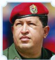
HUGO CHÁVEZ, EXPRESIDENTE DE VENEZUELA

“Bolivia tuvo mar, y yo sueño con algún día venir a bañarme en una playa boliviana”