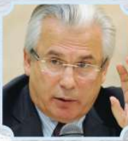
BALTASAR GARZÓN, JUEZ ESPAÑOL (2015)

“Mi consejo es que ustedes (los chilenos) tienen mucha costa, que (los bolivianos) tengan un poquito y superemos la Guerra del 79 realmente en forma verdadera”.