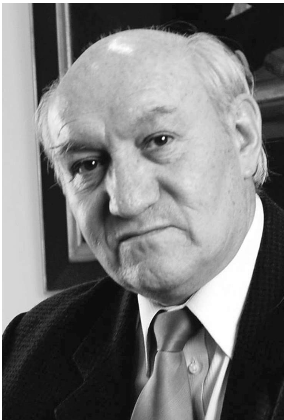
Fotografía del historiador

- ¿Cuáles son las variables que llevaron al oficialismo al resultado