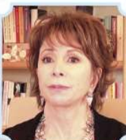
ISABEL ALLENDE, ESCRITORA Y NOVELISTA CHILENA (2013)

“Creo que es una demanda absolutamente justa, y creo que la decisión de la CIJ abre esa puerta para que de una vez se consolide lo que es un derecho de todo el pueblo boliviano”.