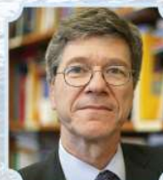
JEFFREY SACHS, ECONOMISTA ESTADOUNIDENSE (2014)

“No sólo el comandante Chávez, yo también iré a darme un remojón en esas aguas heladas del mar boliviano, por el que canté tantos himnos en mi infancia cochabambina”.