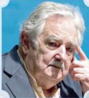
PEPE MUJICA, EX PRESIDENTE DE URUGUAY (2015)

“Creemos que no puede haber integración si no hay una igualdad de condiciones para todos los integrantes del continente, especialmente si no hay una solución definitiva y duradera dignificante para el pueblo boliviano en relación a la soberanía marítima...”