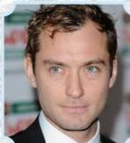
JUDE LAW, ACTOR BRITÁNICO (2015)

“Debe tener una salida, tiene que haber un arreglo, en algún momento estoy segura que se dará...”