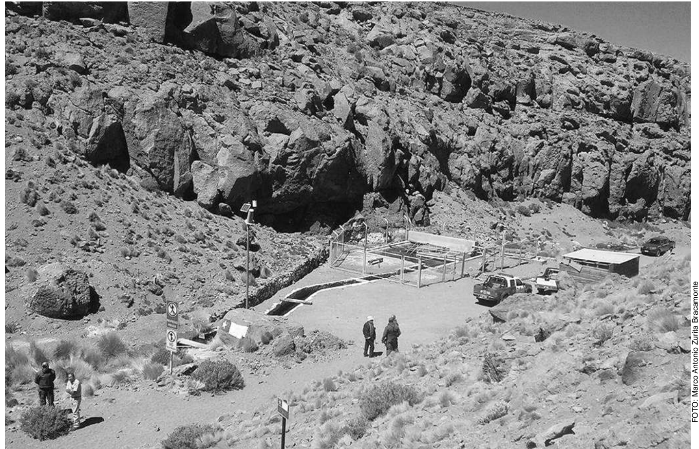
Una comitiva de la que yo formé parte, en mi calidad de profesor de Historia y Geografía e investigador local, visitamos el Silala por el lado chileno.

Circulamos por el cauce del río Inacaliri, de curso endorreico (no desemboca a ninguna cuenca que tenga contacto con el mar), y pasamos por el retén fronterizo que Carabineros de Chile tiene ahí, para meternos finalmente al camino que nos llevaba hasta Silala. Nos llamó la atención que el terreno está cercado, señalando clara-