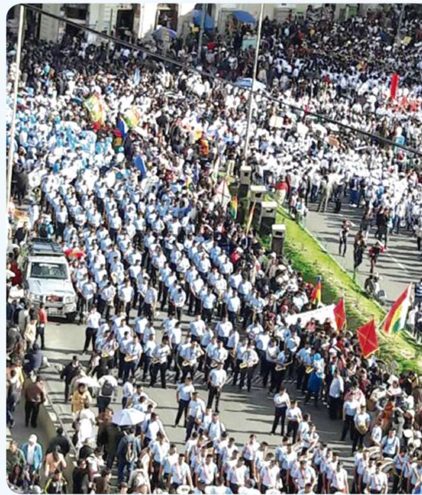
Masivas concentraciones en las ciudades bolivianas.

“Con la presentación de este último alegato, avanzamos un