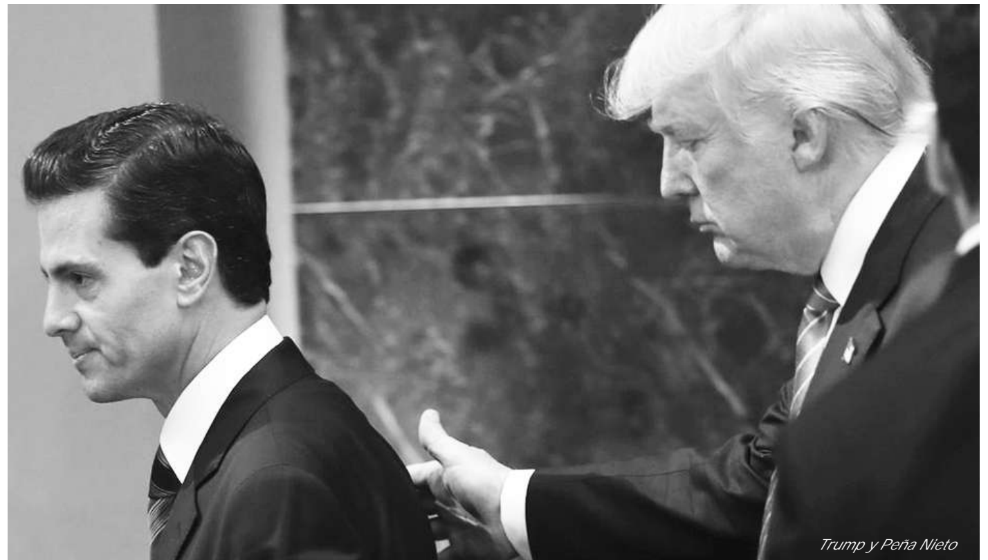
Trump y Peña Nieto

Por otro lado, la opinión pública en Latinoamérica, particularmente la mexicana (por obvias razones), se desgarran las vestiduras cuando se hace referencia al muro fronterizo promovido por Trump, ¡pero se les olvida que dos terceras partes de ese muro ya se construyeron! Una parte se erigió en el sexenio de Fox (2000-2006) y la otra