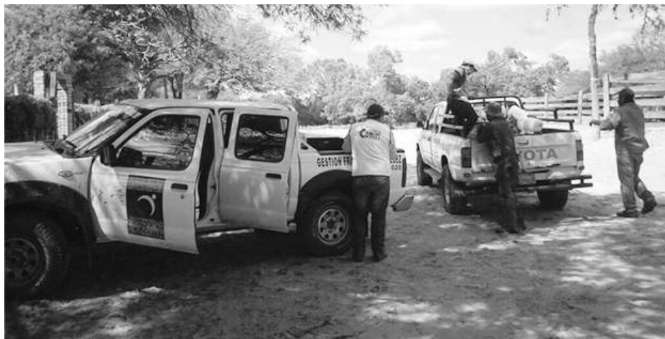
El equipo de profesionales que se desplazó desde Camiri y Santa Cruz hasta Boyuibe

*Ingeniero Zootecnista. Especialidad en la producción animal, mejoramiento genético, pastos y forrajes, reproducción animal, sanidad preventiva, nutrición animal y economía animal.