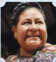
RIGOBERTA MENCHÚ, PREMIO NOBEL DE LA PAZ (1998)

“La esperanza de que los problemas territoriales de América Latina puedan resolverse dentro de un marco de solidaridad internacional, debe inspirar a todas las naciones del hemisferio con el mismo espíritu de armonía del acuerdo entre EEUU y México”.