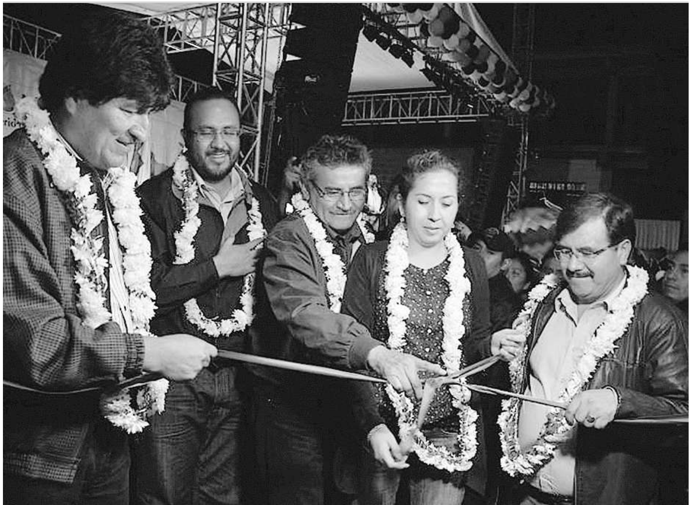
Autoridades nacionales - departamentales y municipales trabajando por el Desarrollo de Cochabamba

En uno de los temas más sensibles para Cochabamba, el agua: Para riego y agua potable, el Presidente entregó otros 61 contratos por 36,6 millones de dólares, 70% aporte del Gobierno nacional y 30% contrapartes de la Gobernación (para los municipios más pobres) y gobiernos municipales. MI RIEGO II permite ampliar un área de 7000 has para producción agrícola, con MI AGUA IV se sigue avanzando