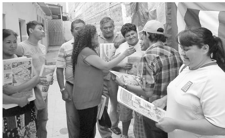
Nuestro programa de radio "La Otra Cara" en directo desde Camiri

Hasta el próximo año, y que la lucha nos una en sólo pensamiento y una sola acción!!!!