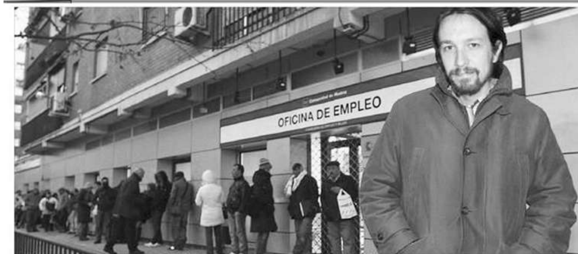
Pablo Iglesias, jefe de la oposición y presidente de PODAMOS, ante la cola de parados de una oficina de empleo en Madrid.